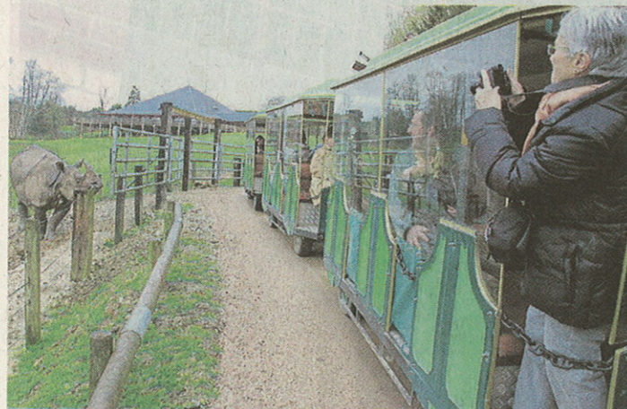
En prenant le safari-train, les visiteurs s'offrent un parcours de vingt minutes à travets les 52 ha du parc.