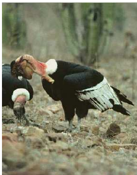
Condors des Andes présents dans la réserve © Chaparri Reserve.

Le programme a vu le jour grâce à la communauté indienne de Santa Catalina de Chongoyape, qui a gracieusement offert plus de 34 000 ha pour créer la Réserve biologique de Chaparri. Le programme de conservation "Chaparri" a pour but de réintroduire les Ours à lunettes et les Condors des Andes dans la forêt sèche de Chiclayo, de créer des corridors pour relier les différentes populations, développer un programme de recherche scientifique et améliorer la qualité de vie des habitants en développant des activités économiques respectueuses de l'environnement.