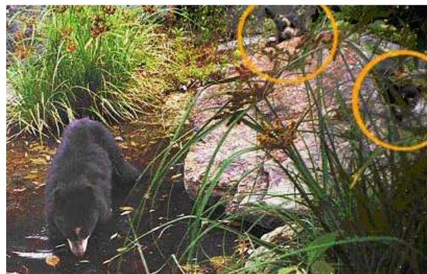
Femelle Ours à lunettes avec 2 de ses petits

La réserve Chaparri a été créée dans l'optique de développer l'écotourisme. En 2005, 9 guides issus de la communauté de Santa Catalina de Chongoyape ont pu faire visiter la réserve à plus de 2 300 visiteurs. Les visites de la réserve sont payantes, procurant alors des revenus à la réserve. Un livre sur la faune de Chaparri a également pu être édité et donné à la communauté qui maintenant le vend aux touristes.