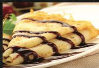
Crêpe au chocolat

Le CERZA vous offre la possibilité d'organiser vos séminaires vos sorties CE, vos assemblées générales dans un cadre exceptionnel avec une organisation sur mesure pour les activités, les repas ou l'hébergement avec le CERZA SAFARI LODGE !