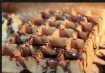
Gaufre au chocolat

La Pagode vous accueille toute l'après-midi pour une pause sucrée !